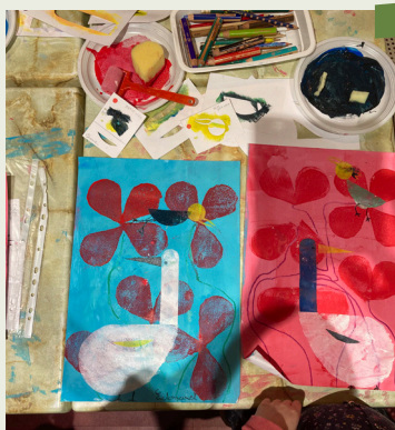
Atelier autour de "Pouik"

Par groupe de 8 participants maxi Durée : 1 heure Tarif : Charte des Auteurs/Illustrateurs >> SITE DE LA CHARTE DES AUTEURS / ILLUSTRATEURS JEUNESSE (Prix sur devis)