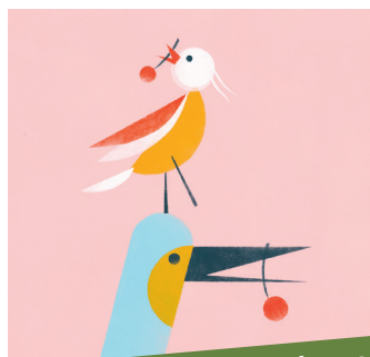
Album "Pouik et le petit oiseau"