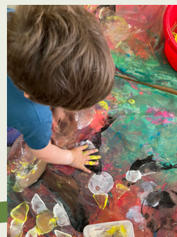
Atelier autour de "Belle étoile"

Atelier dessin, découpage et pochoir autour du thème de la nature