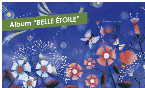
Albums aux Éditions Didier jeunesse